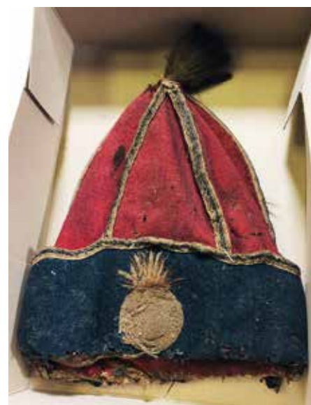
Afb. 2. Achterkant met een gouden granaat, het embleem van de grenadiers