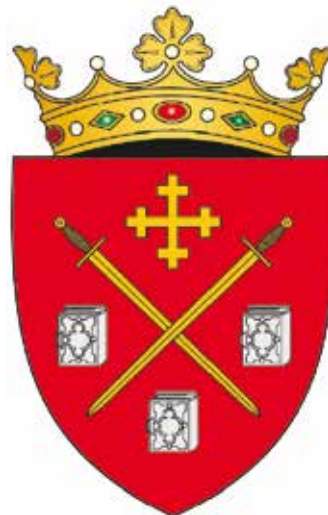
Wapen raion Briceni (uit: Stemele și drapelele raioanelor Republicii Moldova)

Op het moment van schrijven van het boek (2018) was het wapen nog niet officieel vastgelegd. 14 Ook de Wikipedia-site van het district geeft in augustus 2022 nog geen eigen wapen. Het hier getoonde wapen is ontworpen door Silviu Andrieș-Tabac en getekend