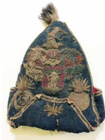
Afb. 1. Voorkant van de grenadiersmijter met wapen

Dat de getoonde grenadiersmijter (afb. 1 en 2) uit de eerste helft van de achttiende eeuw en tevens mogelijk uit Neder-