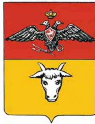
Wapens van het gouvernement Bessarabië uit respectievelijk 1815 en 1826

Van hun naam is ook de naam van het raion afgeleid. In het graf van Vlaicu Vodă (Vladislav I, 1364- circa 1376) in de kathedraal van het klooster van Curtea de Argeș werden heraldische knopen gevonden met het volgende wapen: gedeeld, I: zeven balken van goud en groen, II: geheel van goud. Het aantal balken werd in het huidige wapen gebracht op tien wat verwijst naar het aantal plaatsen in het district. Groen en goud zijn ook de kleuren van de Moldavische Mușat-dynastie die ook voorkomen in het wapen van Stephanus de Grote. De leeuw komt uit het wapen van de historische regio Bender/Tighina, met de kleuren en wapenfiguur uit het wapen van 1928. De gereedschappen die de leeuw vasthoudt, hamer en moersleutel, verwijzen naar de spoorweg die een belangrijke rol speelt in de economie van de regio. 13