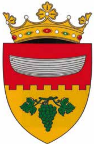
Andere versie van het wapen op Heraldicum.ru , getekend door I. Caminschi. Dit is ook de versie die Stemele și drapelele raioanelor Republicii Moldova geeft

wijde regio gevonden zijn. 22 De muur kwam ook al voor op de wapens van de regio Cahul uit 1860, 1928 en 2000. Het schip verbeeldt het vele water in de regio: het waterrijke gebied langs de Proetrivier, de Salcia Marerivier, de Salcia Micărivier, het Manta- en Beleumeer en het natuurgebied Prutul de Jos, maar ook voor visserij als een van de belangrijkste economische activiteiten van de lokale bevolking. Het rood kwam ook al voor op oudere wapens in het gebied. De druiventros staat voor de wijnbouw, de belangrijkste economische activiteit in het gebied. Er zijn wijnboerderijen in onder andere Borceag, Brînza, Burlacu, Găvănoasa en Slobozia Mare. Het groen staat voor natuur en vegetatie. Het is de kleur van vrijheid, schoonheid, vreugde, gezondheid en hoop. Het goud staat voor rijkdom, prestige, deugd, grandeur en intelligentie. 23