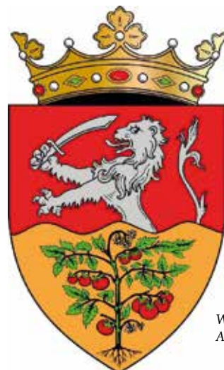
Wapen Anenii Noi

In het wapen van Anenii Noi is de leeuw klimmend geworden en heeft hij een zwaard gekregen om aan te geven dat