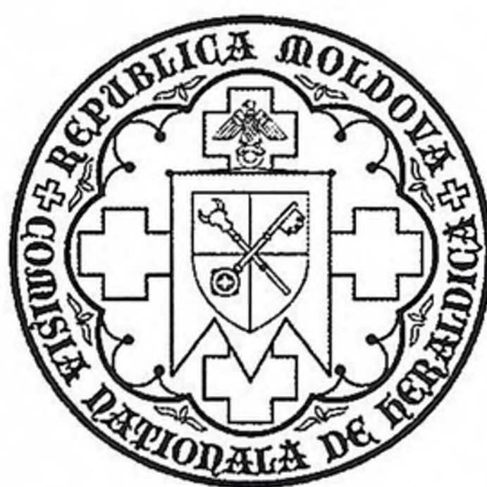
Comisia Națională de Heraldică de pe lângă Președintele Republicii Moldova